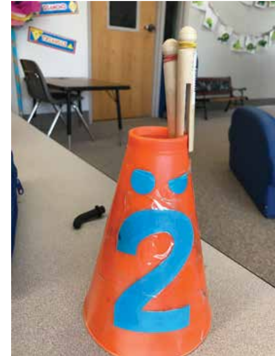
Para los niños que todavía están aprendiendo a reconocer letras o números, incluya figuras pequeñas para indicar el número de niños que pueden asistir a un centro a la vez.

Coloque el letrero o el cono cerca de la entrada del Centro de aprendizaje cuando el centro esté disponible para su uso. Retire el letrero o cono cuando el centro esté cerrado y no sea una opción que pueda elegirse.