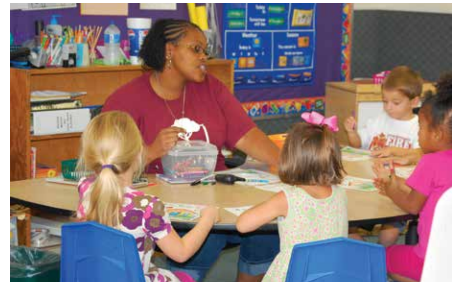
Los maestros asignan grupos pequeños homogéneos (con destrezas similares) para dirigirlos hacia sus puntos de más necesidad.

El uso de la Mesa de enseñanza y la Mesa de trabajo varía según la cantidad de adultos en el salón y el tiempo de instrucción disponible cada día.