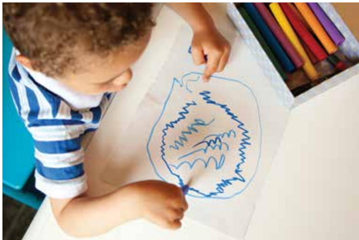
Establecer destrezas fundamentales como la alineación y la orientación influye positivamente en el rendimiento futuro de los niños tanto en la escritura como en la lectura.

Los estudios confirman que establecer destrezas fundamentales sobre la impresión, la alineación vertical y horizontal y la orientación de arriba a abajo y de izquierda a derecha, tienen un impacto positivo en el éxito futuro de los niños en su formación y en la escritura (NELP, 2008; Schickedanz & Collins, 2013). Por lo tanto, es adecuado proporcionar instrucción explícita y práctica guiada para desarrollar la formación temprana y la mecánica de la escritura o destrezas fundamentales antes de que los niños produzcan signos con significado al copiar o escribir.